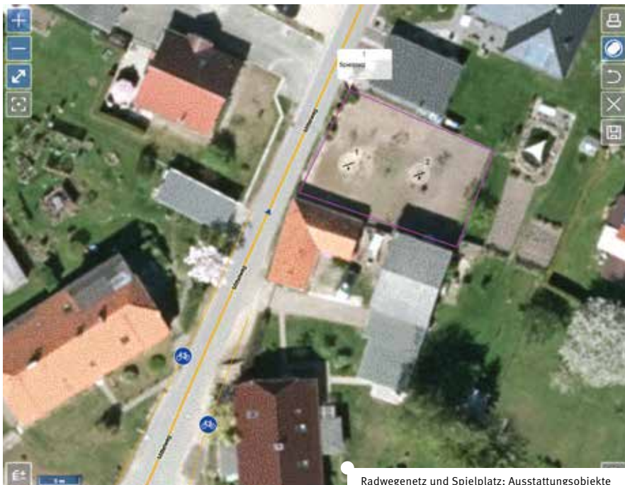
Radwegenetz und Spielplatz: Ausstattungsobjekte des kommunalen Straßen- und Wegenetzes