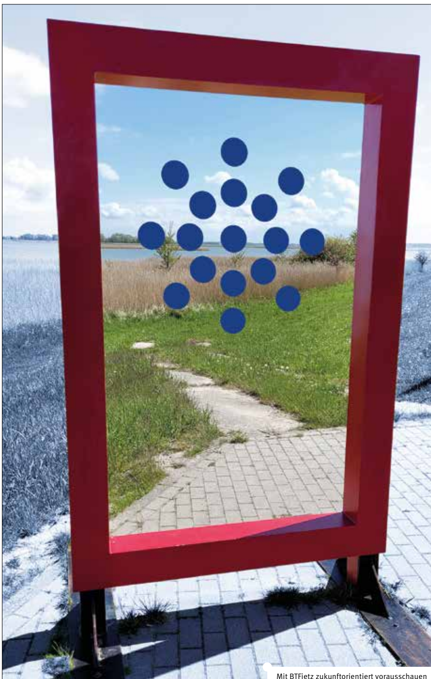
Mit BTfietz zukunftsorientiert vorausschauen